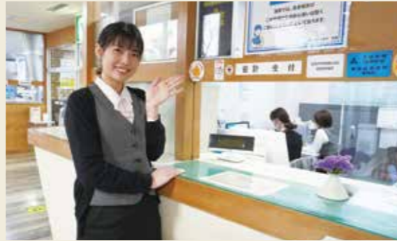
正面玄関すぐの窓口にてお待ちしております