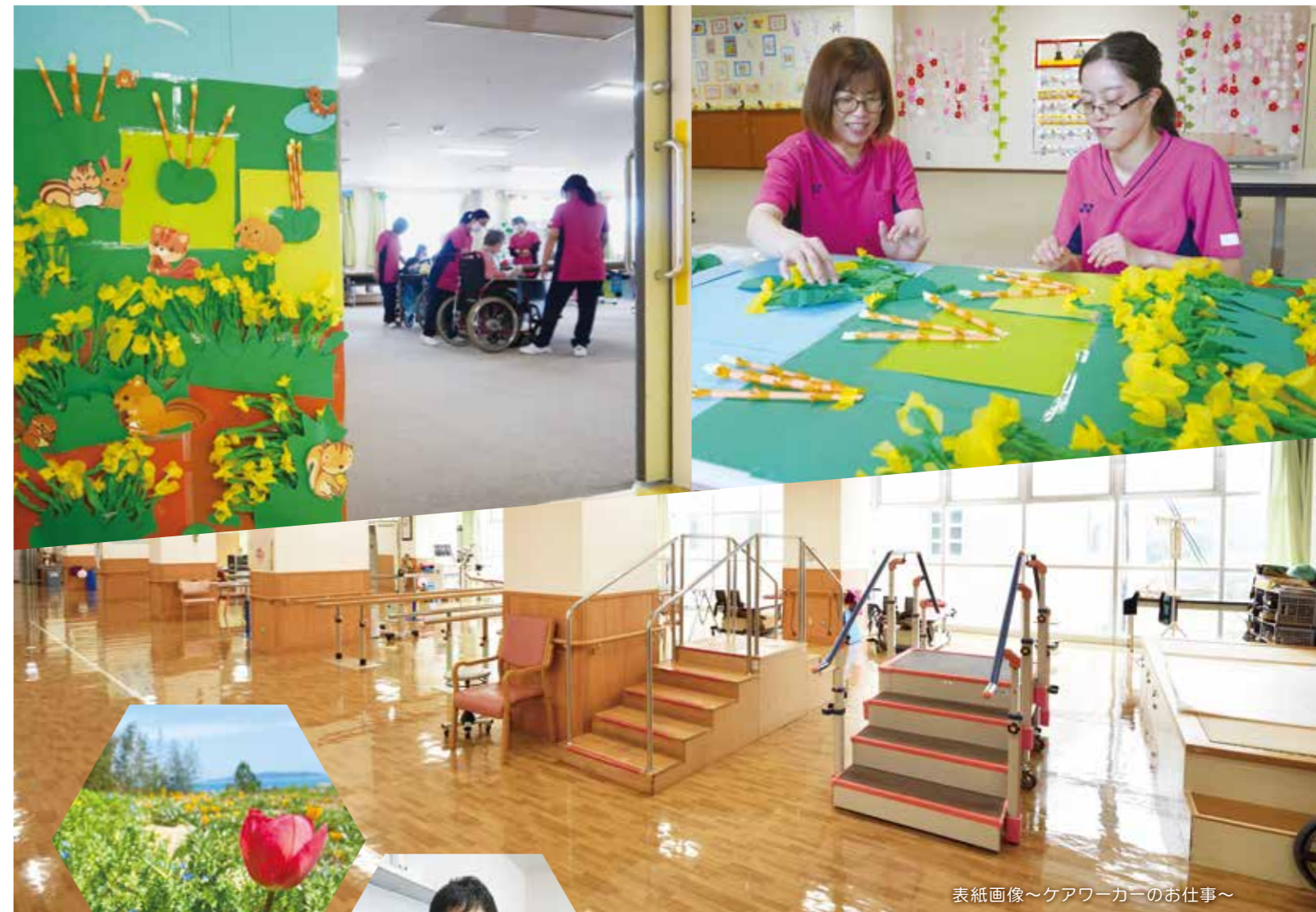
表紙画像～ケアワーカーのお仕事～