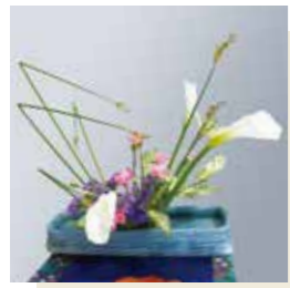
正面玄関には生け花！

気配り、目配り、心配りができる職員が多く、みんなで支え合いながら日々の業務に努めています。お困りの事・ご心配な事がありましたら、窓口にお声掛けください。